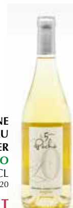
DOMAINE CHANTE L'OISEAU 5 ÈME PÊCHE VIOGNIER IGP PÉRIGORD BIO 2020 75CL VBVD004B20 14,46€ HT