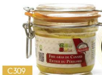
C309 FOIE GRAS DE CANARD ENTIER DU PÉRIGORD 180 g

PRIX PUBLIC TTC 17€25 à partir de 4 unités 11€40 TTC soit 10€ 81 HT -34%