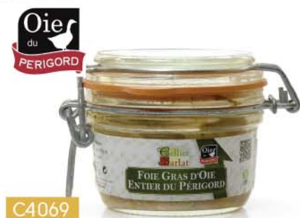
C4069 FOIE GRAS D'OIE ENTIER DU PÉRIGORD 130 g

PRIX PUBLIC TTC 22€50 à partir de 4 unités 15€30 TTC soit 14€ 90 HT -32%