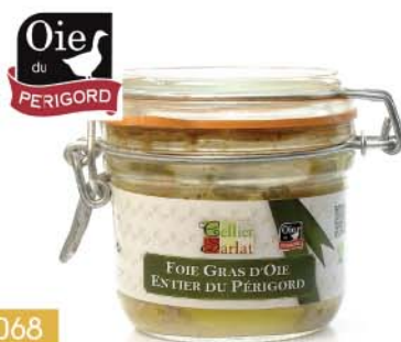
C4068 FOIE GRAS D'OIE ENTIER DU PÉRIGORD 180 g

PRIX PUBLIC TTC 22€50 à partir de 4 unités 15€30 TTC soit 14€ 90 HT -32%