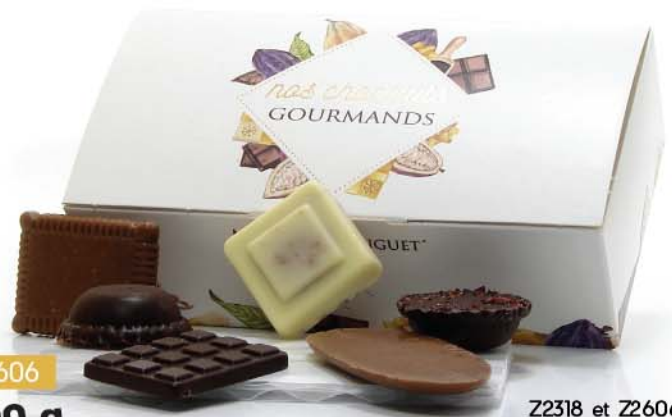
Z2318 et Z2606