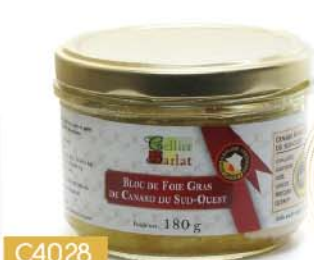
C4028 BLOC DE FOIE GRAS DE CANARD IGP SUD-OUEST 180 g

PRIX PUBLIC TTC 25€90 à partir de 4 unités 18€15 TTC soit 17€ 20 HT -30%