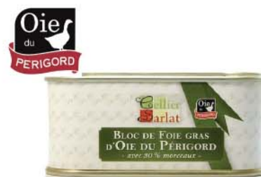
C4073 BLOC DE FOIE GRAS D'OIE ORIGINE PÉRIGORD 200 g

PRIX PUBLIC TTC 34€50 à partir de 4 unités 22€80 TTC soit 21€ 4 HT -34%