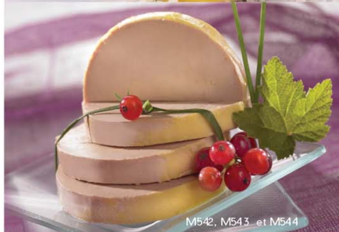
M542, M543 et M544