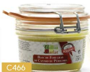
C466 BLOC DE FOIE GRAS DE CANARD IGP PÉRIGORD 130 g

PRIX PUBLIC TTC 19€95 à partir de 4 unités 13€20 TTC soit 12€ 51 HT -34%