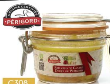
C308 FOIE GRAS DE CANARD ENTIER DU PÉRIGORD 130 g

PRIX PUBLIC TTC 19€95 à partir de 4 unités 13€20 TTC soit 12€ 51 HT -34%